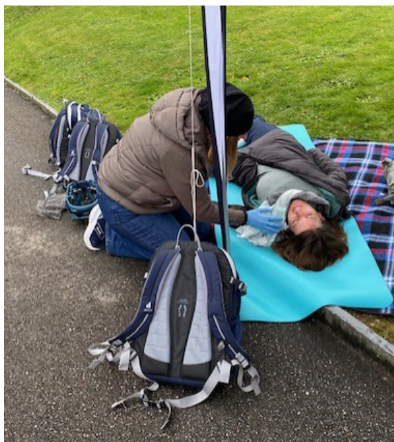
Üben von Notfallszenarien für den Ernstfall.

bildungen im Bereich Notfallsituationen begleitet. Notfälle treten heute häufiger auf, insbesondere im Nachtpikettdienst, wodurch vermehrt nächtliche Einsätze nötig wurden.